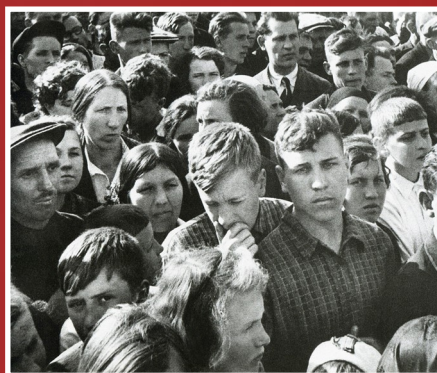
Советские люди слушают правительственное заявление. 22 июня 1941 года