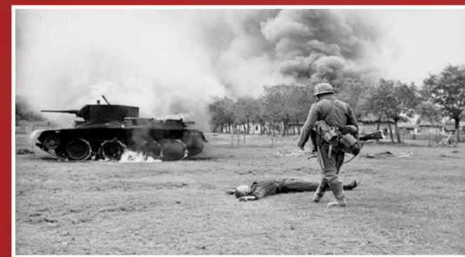
Первые шаги немцев по советской земле. 22 июня 1941 года