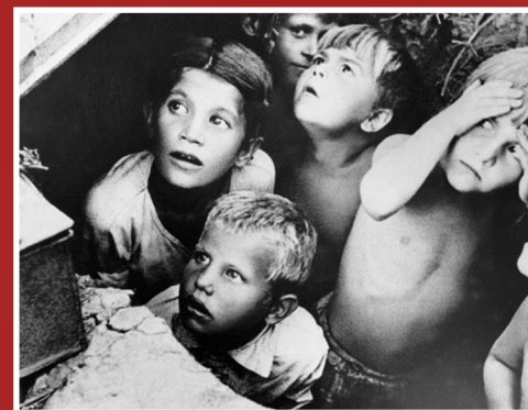
Советские дети во время фашистской бомбежки под Минском. Первые дни войны 1941 года

Тот самый длинный день в году С его безоблачной погодой Нам выдал общую беду На всех, на все четыре года.