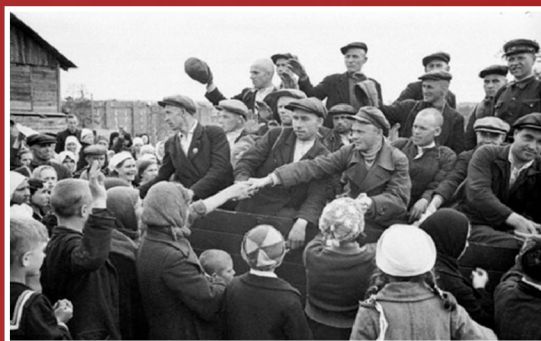
Проводы на фронт. Московская область, июнь 1941 года