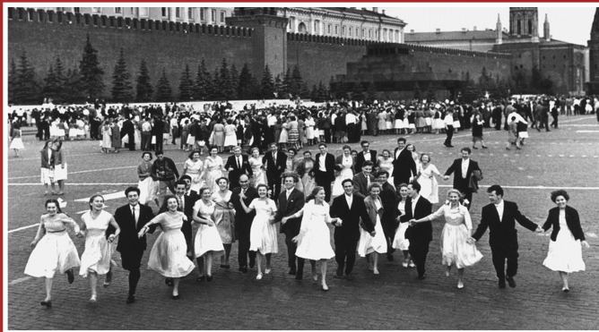
Казалось, что впереди вся жизнь. 21 июня 1941 года

Великая Отечественная война окончилась победой СССР, но какой ценой?! Ценой человеческих страданий и огромных потерь, которые выпали на долю советского народа. Мировая история еще не знала таких разрушений, варварства и бесчеловечности, каким отмечен путь гитлеровцев по советской земле.