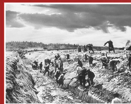
Рытье окопов гражданским населением. Июнь 1941 года