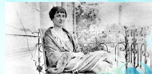
Анна Ахматова в Севастополе

«Степной бугор над бухтой синей И высоты просторный свет, И запах моря и полыни, И мне, должно быть, восемь лет»