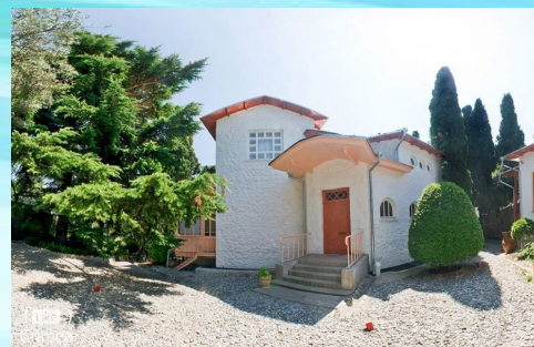
г. Ялта. Дом-музей А.П. Чехова «Белая дача»

Антон Павлович писал друзьям: “Моя ялтинская дача вышла очень удобной. Уютно, тепло и вид хороший. Сад будет необыкновенный. Сажал я сам, собственноручно”.